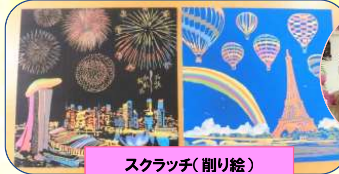
スクラッチ(削り絵)