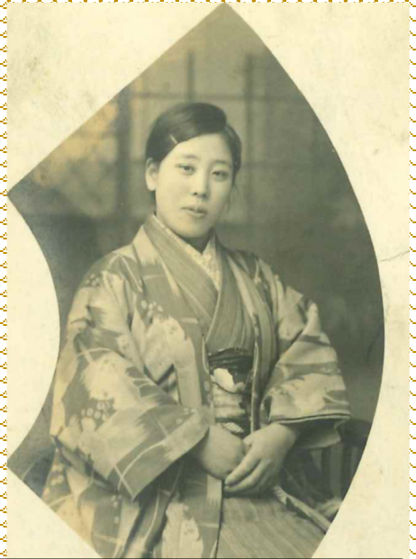
昭和8年 22歳誕生日の冬様

～冬様へ感謝の気持ちをこめて～アルバム集 いつも元気でいてくれて、ありがとうございます。