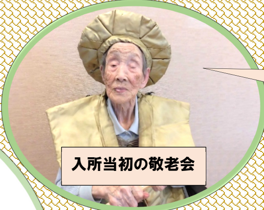
入所当初の敬老会