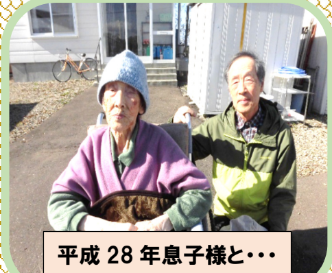
平成 28年息子様と・・・